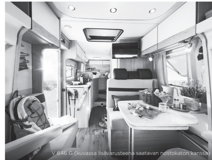
V 646 G (kuvassa lisävarusteena saatavan nostokaton kanssa)