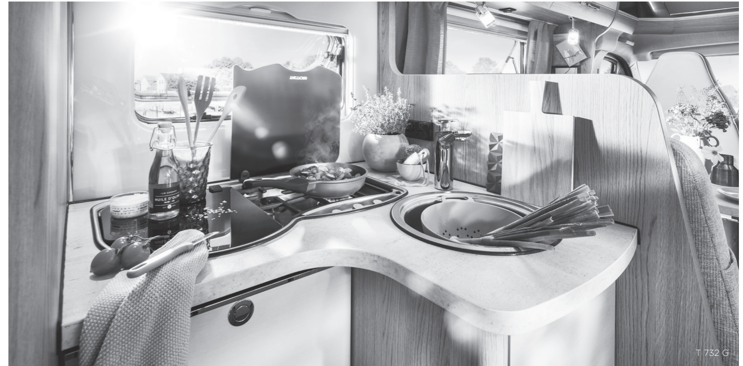
T 732 G