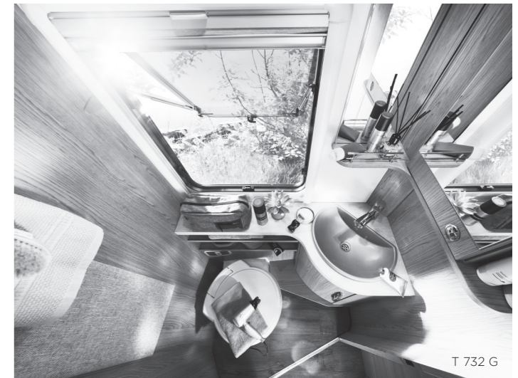
T 732 G